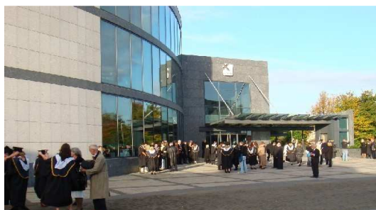
Dublin City University