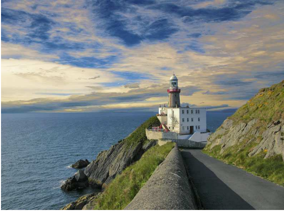
Il faro di Bailey