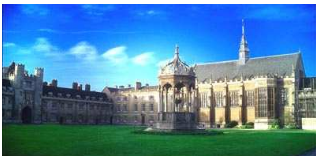
L'Università di Dublino

La National University of Ireland è la più grande università irlandese: in realtà si tratta di una università confederata, con più università distaccate che ne fanno parte, fra queste l'importantissimo University College of Dublin che gode di altissima reputazione anche all'estero ed ha sede nel territorio della contea di Dun Laoghaire. La più giovane è la Dublin City University , sorta per ottemperare alla sempre maggiore domanda negli altri college e specializzata in economia, ingegneria e corsi scientifici.