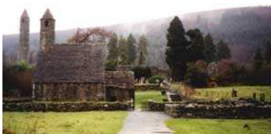
I resti del monastero di Glendalough

Il sito monastico comprende anche la torre (vedi foto sotto) a base circolare alta 33 metri e la croce di San Kevin. La torre venne costruita negli anni delle incursioni vichinghe (fino al 1066 circa) per custodire le sacre reliquie, i libri ed i calici usati nelle cerimonie religiose.