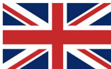
Se sovrapponetate le tre croci si crea l'Union Jack.