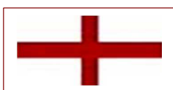
Croce di San Giorgio, la bandiera dell'Inghilterra

L' Union Jack è il simbolo dell'unione delle nazioni all'interno della Gran Bretagna perché comprende le bandiere di ogni singolo stato membro: si tratta infatti di tre bandiere in una, ossia tre nazioni unite in una famiglia. È l'Union Jack, infatti, niente meno che un altro nome per dire " Union flag ". Una trinità di nazioni. Le croci visibili nelle bandiere portano il nome del santo patrono di ogni singola nazione: San Giorgio, patrono dell'Inghilterra, Sant'Andrea, patrono della Scozia e San Patrizio, patrono dell'Irlanda. La bandiera gallese (il drago gallese) non è compresa nell'Union Jack perché il Principato del Galles era già unito all'Inghilterra quando la prima Union Jack fu disegnata nel 1606.