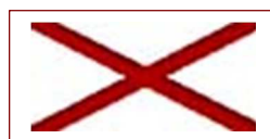
Croce di San Patrizio, la bandiera dell'Irlanda