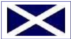
Croce di Sant'Andrea, la bandiera della Scozia