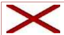
Croce di San Patrizio, la bandiera dell'Irlanda