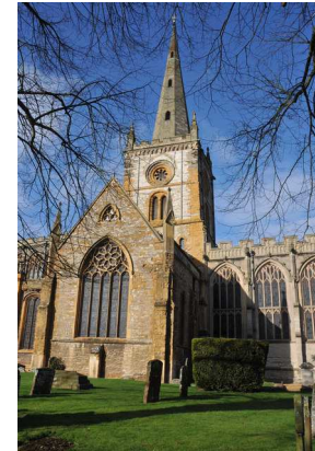
Holy Trinity Church dove il poeta fu battezzato e dov'è sepolto.