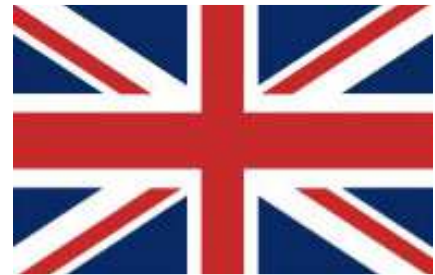
Se sovrapponete le tre croci si crea l'Union Jack