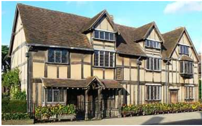
La casa natale di William Shakespeare nella quale il poeta visse la sua infanzia, è ora adibita a museo