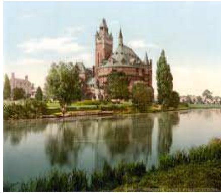
Il Royal Shakespeare Theatre sede della Royal Shakespeare Company che gestisce il festival annuale shakespeariano