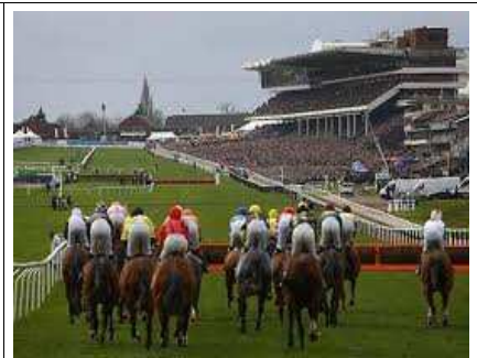
Cheltenham Gold Cup