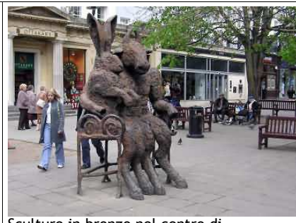
Sculture in bronzo nel centro di Cheltenham