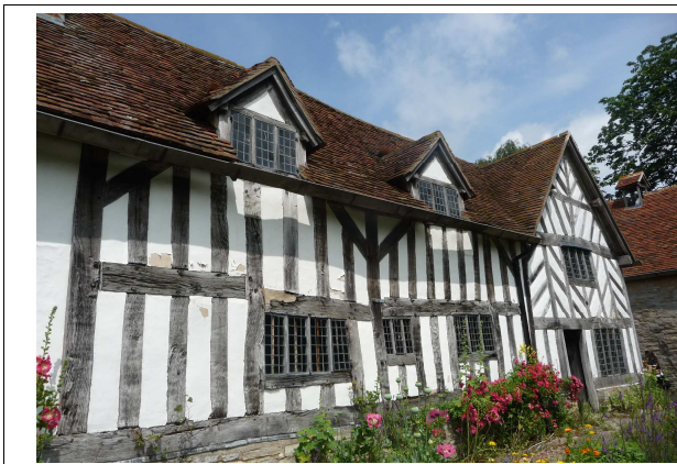
Mary Arden Farm fu la casa della madre del drammaturgo. Situata a Wilmcote, una località a tre miglia da Stratford-upon-Avon, nella casa e nella fattoria si rivive l'atmosfera del 16° secolo