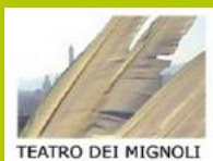
TEATRO DEI MIGNOLI