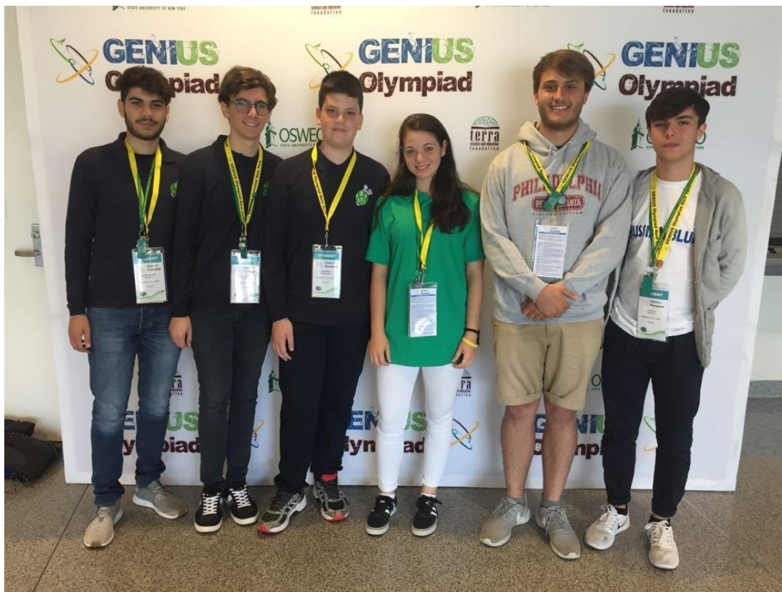
Figura 5. I sei studenti dell'Ennio di Gallipoli e del Sobrero di Casale Monferrato. Medaglia d'oro e d'argento a GENIUS 2017

La finale europea è la conclusione degli sforzi avviati un anno prima dai diversi organizzatori nazionali che selezionano i rispettivi rappresentanti. L'Italia può inviare fino a tre progetti per un totale di 6 candidati. All'evento europeo partecipano quasi 40 paesi con un centinaio di progetti realizzati mediamente da 150 giovani.