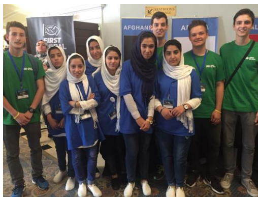
Figura 4. Studenti del Buonarroti-Pozzo di Trento con le ragazze dell’Afghanistan a FIRST Global, 14-17 luglio 2017