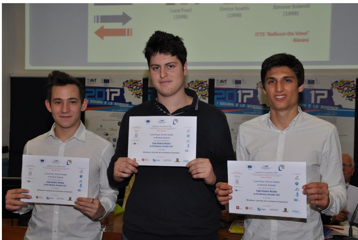
Figura 15. Studenti italiani accreditati con I giovani e le scienze all'Expo Messico 2017.