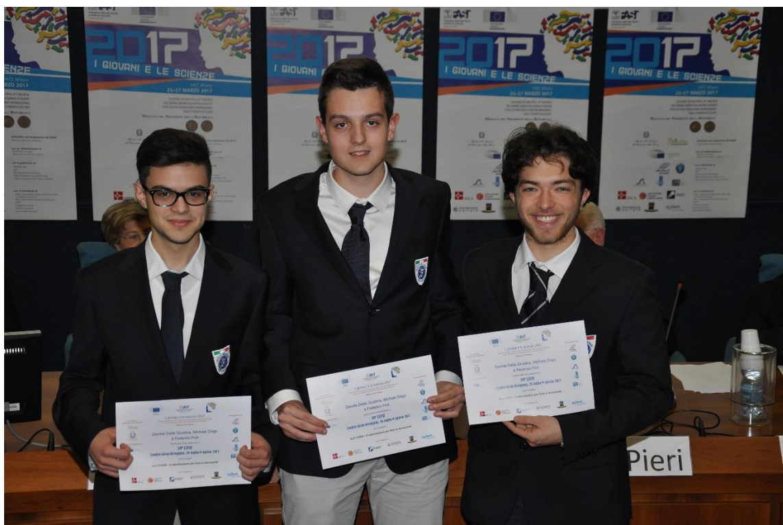
Figura 13. Studenti del Malignani accreditati per LIYSF 2017