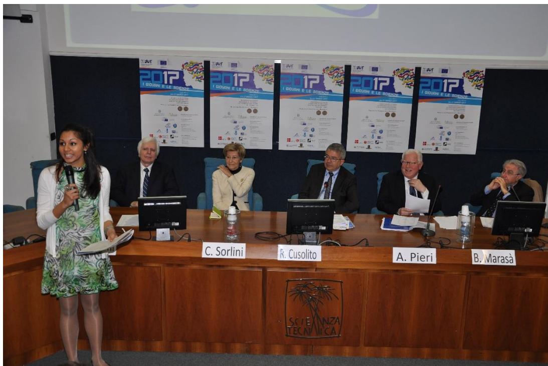
Figura 11. Tavolo dei relatori alla premiazione de I giovani e le scienze 2017, Milano

E' il punto di incontro per far conoscere le iniziative e le aspettative di giovani, insegnanti, leader per la ricerca; strumento per consolidare le motivazioni e contribuire alla crescita personale. I giovani e le scienze è il bel ricordo che ritorna nelle menti di ragazze e ragazzi che si sono incontrati nelle finali di Milano e negli Expo Sciences internazionali o hanno partecipato a congressi, science camp, workshop, science photo contest, ecc... E' il sogno di giovani che, avendo ascoltato le testimonianze dei partecipanti alle varie iniziative, si preparano a diventare i nuovi protagonisti delle attività previste per il prossimo futuro.