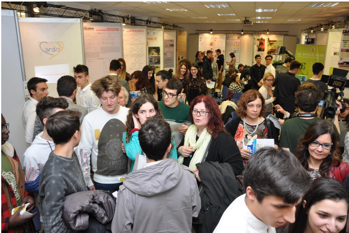
Figura 12. Pubblico a I giovani e le scienze, Fast, 25-27 marzo 2017

L'attività della Federazione verso i giovani si concentra sulla valorizzazione dei talenti. Infatti, nonostante la discutibile opinione sulla scuola italiana anche a livello internazionale (indagine Pisa dell'Ocse), è pur vero che studenti eccellenti e di ottimo livello del nostro paese diventano ricercatori e scienziati apprezzati e richiesti in tutto il mondo. Per questo occorre offrire le migliori opportunità affinché i meritevoli possano realizzare i propri programmi ed abbiano la possibilità di emergere e competere a livello europeo ed internazionale già nella scuola superiore.