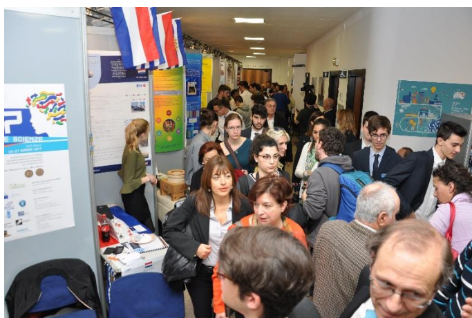
Figura 1 e 2. Pubblico a I giovani e le scienze, Fast, 25-27 marzo 2017